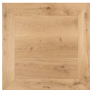
P01 Prelevigato Unfinished

SPESS./THICK 15mm LARGH./WIDTH 955-1020mm LUNGH./LENGTH 970-1020mm